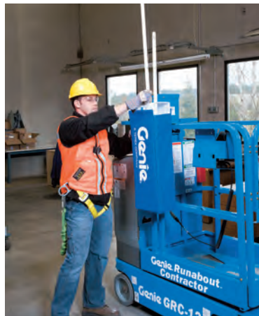
Porte tubes fluorescents (disponible sur panier étroit ou très étroit uniquement)