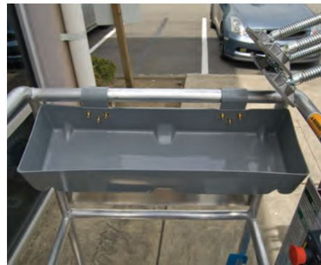
Bac de travail (non disponible sur les paniers étroits ou très étroits)