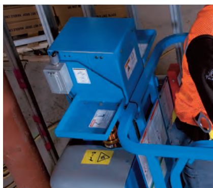
Plateau de travail Runabout Contractor