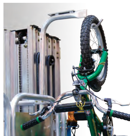
Crochet double vélo QuickStock

Un moyen commode de monter et descendre les vélos de présentoirs ou étagères élevés — et qui économise à l'opérateur des manœuvres délicates dans le panier, un vélo à la main. Peut supporter jusqu'à 20 kg.