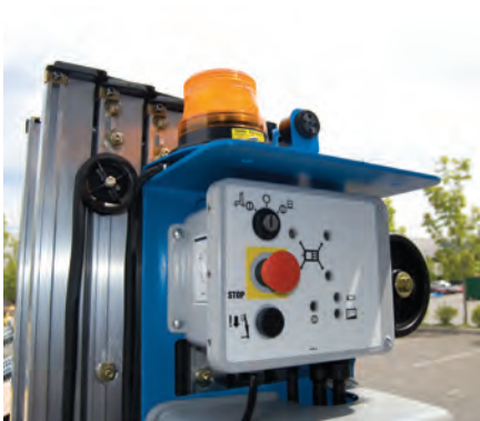
Feu d'avertissement de fonctionnement