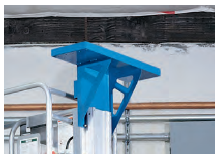
Plateau de travail Runabout